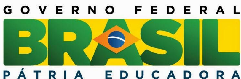
Figura 1 . Slogan do segundo mandato da presidente Dilma Rousseff (PT) 2015-2018.

Tendo essa função de “integração” que que permite a submissão do indivíduo ao Estado, é que lançamos um olhar sobre o slogan (vide fig. 01), que inaugura o segundo mandato da presidente Dilma Rousseff (2015-2018), que tem na questão educacional sua proposta de ação.