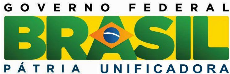
Figura 2 Paráfrase construída sobre o slogan do segundo mandato da presidente Dilma Rousseff (PT) 2015-2018.

Construção possível, ainda mais se tomarmos o contexto político de cisão entre o que se convencionou chamar de “esquerda” representada pelo Partido dos Trabalhadores (PT), e uma “direita”, que seria formada pelos partidos que fizeram oposição a coalizão que vencera as eleições de 2014, capitaneada pelo PT 2 .