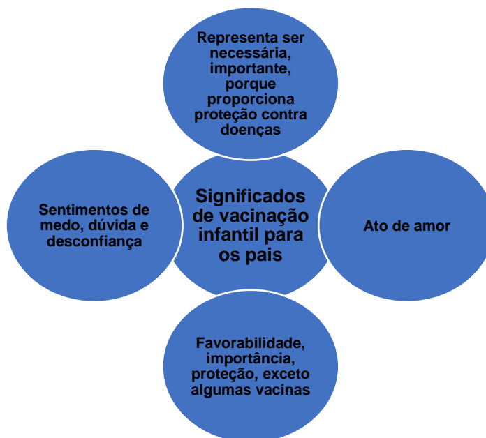
Figura 2: Ideias centrais do tema “Significados de vacinação infantil para os pais”

Para facilitar a compreensão e a visualização das ideias centrais do tema: “Significado de vacinação infantil para os pais”, construiu-se a figura 2 contendo o mencionado tema e suas respectivas representações.